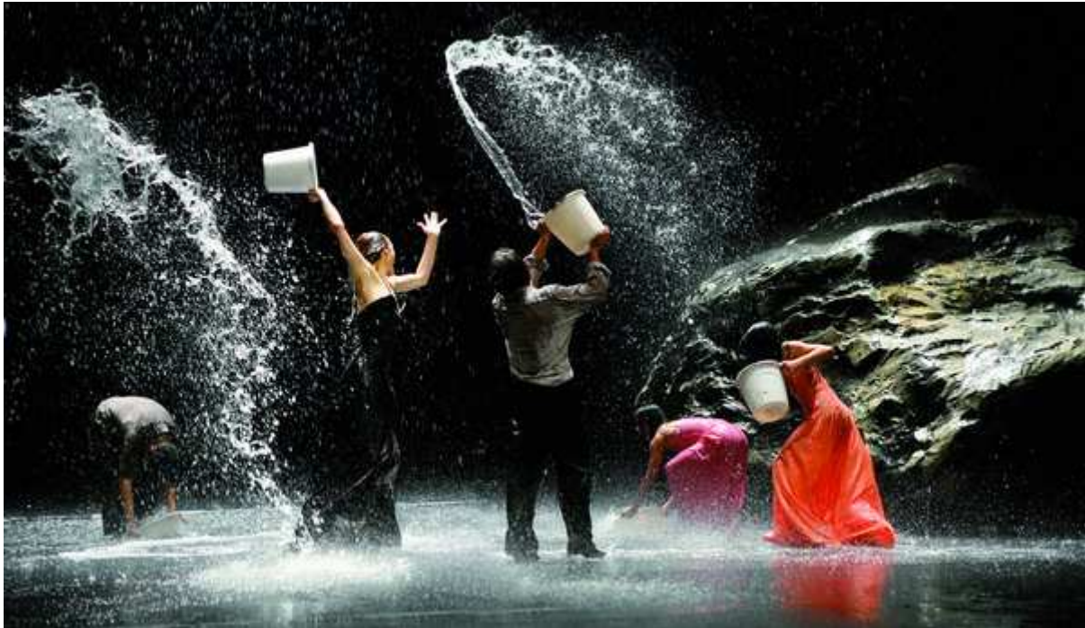
Danse Théâtre. Pina Bausch