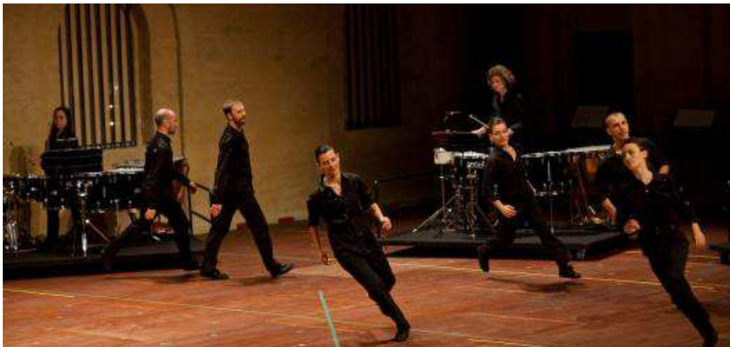
Pléiades, Théâtre de Caen