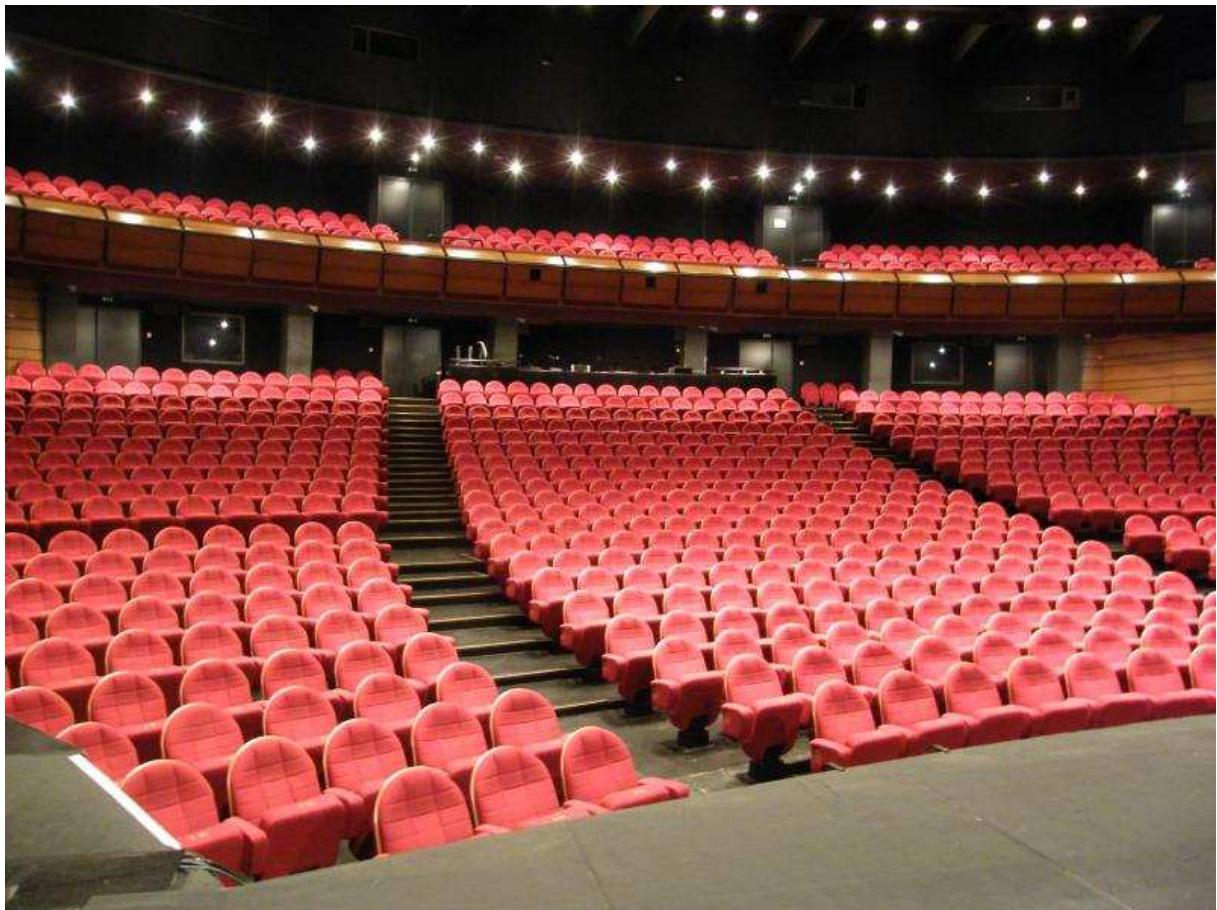
Salle Philippe Genty. MCNA. Nevers