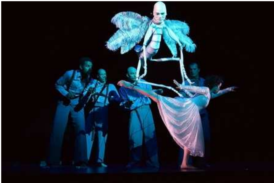
Compagnie Philippe Genty