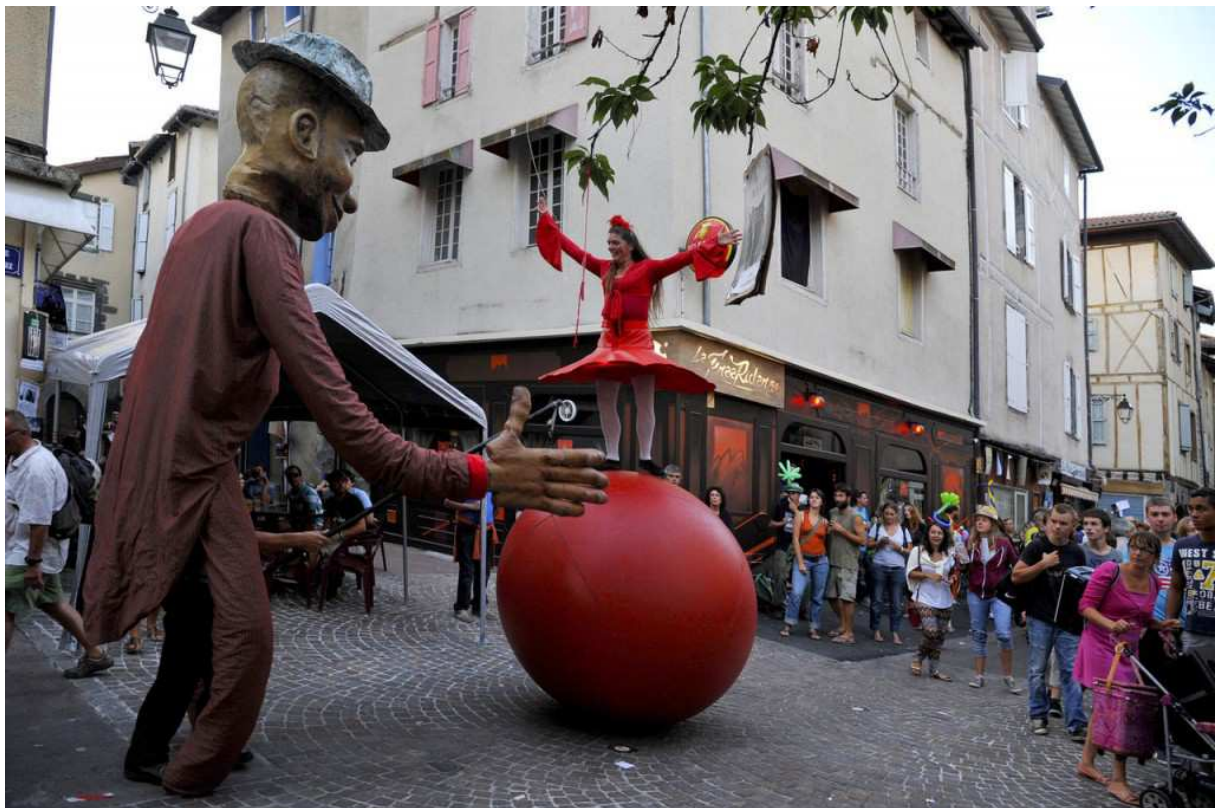
Théâtre de rue. Aurillac